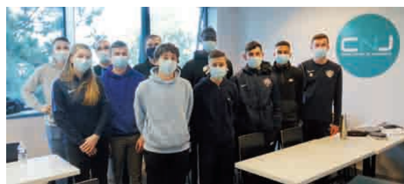
ZOOM SUR ... L'ACADÉMIE FUTSAL DE NANTES

L'Académie Futsal de Nantes est un projet né d'une volonté d'accompagner la jeunesse nantaise du futsal vers l'excellence sportive, tout en lui garantissant un avenir professionnel à la hauteur de ses ambitions. Ce dispositif original est proposé aux jeunes de 15 à 17 ans et coordonné par le Nantes Métropole Futsal, en coopération avec quatre autres clubs de la métropole : l'Association Nantaise Futsal, le Nantes Doulon-Bottière Futsal, l'Etoile Nantaise Futsal et la Stéphanoise Futsal. Au menu pour les futsaliseurs ascendants citoyens : des entraînements supplémentaires avec des éducateurs certifiés, un suivi scolaire individualisé avant chaque séance et des activités éducatives tout au long de l'année pour garantir l'épanouissement et l'avenir personnel de chaque jeune. La première promotion de l'Académie recense 18 jeunes passionnés. Ils sont encadrés par un staff composé de 3 entraîneurs (dont un spécifique gardien) de 3 clubs nantais, ainsi que d'une responsable des activités extra-sportives et scolaires. Financièrement soutenu par le Nantes Métropole Futsal et avec les soutiens de la Ville de Nantes et de la Ligue de Football des Pays de la Loire, l'Académie entend s'implanter durablement sur le territoire sportif ligérien. Pour retrouver l'actualité des jeunes de l'Académie Futsal de Nantes, rendez-vous sur ses pages Facebook et Instagram dédiées ! ■